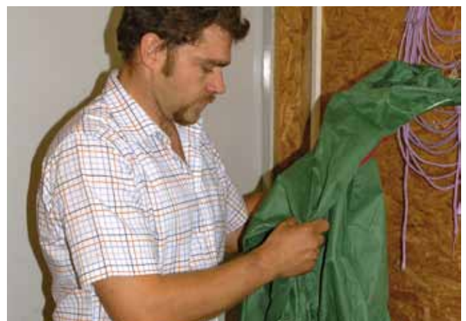
Im Quarantänebereich sind eigene Bekleidung, Stiefel und Gerätschaften zu verwenden, die nicht gleichzeitig bei der bestehenden Herde verwendet werden dürfen.