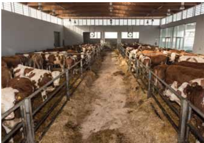
Quarantänemaßnahmen im Ausmaß von mindestens 3 Wochen (besser 6 Wochen) dienen dazu, die eigene Herde vor möglichen Infektionen durch die zugekauften Tiere zu schützen.

In der Quarantäne können Tiere auf erkennbare Atemwegs-, Darm-, Haut- oder Eutererkrankungen untersucht werden. Labordiagnostische Maßnahmen können einen festgelegten Gesundheitsstatus (z.B. Freiheit von Paratuberkulose, Staphylokokkus aureus) absichern.