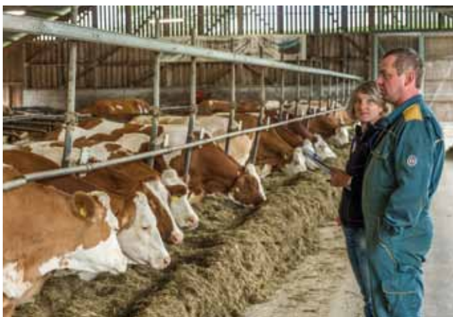
Die regelmäßige Tierbeobachtung und Tierkontrolle tragen zur Aufrechterhaltung der Tiergesundheit bei und ermöglicht die Früherkennung von Krankheitsanzeichen.

Regelmäßige Tierbeobachtung und Tierkontrolle tragen zur Aufrechterhaltung der Tiergesundheit bei und ermöglichen die Früherkennung von Krankheitsanzeichen. Eine tägliche Beobachtung der