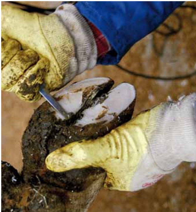
Werkzeuge, z.B. solche zur Klauenpflege, sind regelmäßig zu reinigen und zu desinfizieren.