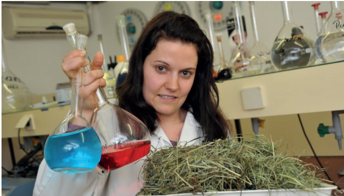
Laborantin: Quelle FML-Rosenau

Eine dem Bedarf bzw. Leistungsniveau angepasste Ration ist das Erfolgsrezept für eine erfolgreiche Nutztierhaltung. Wirtschaftseigenes Futter stellt in den meisten Betrieben den bedeutendsten Rationsbestandteil dar. Speziell bei Gras- und Maiskonserven zeigen Futteranalysen jedoch große Variationen in der Qualität, sei es bei Inhaltsstoffen, Konserviererfolg oder Keimbela-stung.