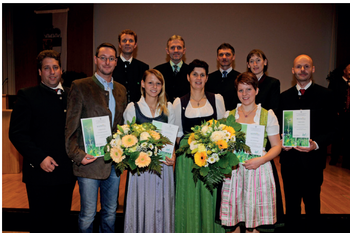
Die MeisterInnen des Jahres aus NÖ mit Beiratsmitgliedern aus NÖ

Im Rahmen der Tagung am Heffterhof in Salzburg wurden 19 Meisterinnen und Meister des Jahres der Abschlussjahrgänge 2015 ausgezeichnet. Für die Auswahl werden der Notendurchschnitt, die Hausarbeit, die Präsentation der Hausarbeit und Projektarbeit, der betriebliche Erfolg, die sonstige Ausbildung und das Engagement in der Gesellschaft berücksichtigt. Wei-