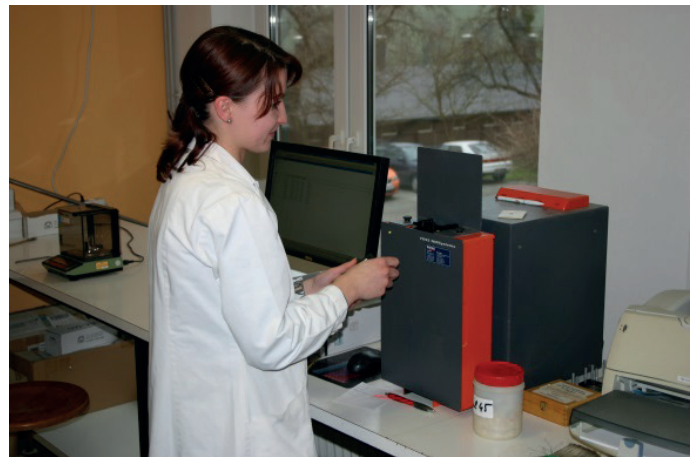
Laborantin am NIRS-Gerät

Weitere Informationen zu Futteruntersuchungen sowie Tarife können der Homepage www.futtermittellabor.at entnommen werden.