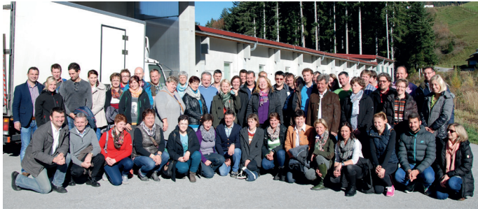
ARGE-Meister-Vorstandsmitglieder von den Bundesländern